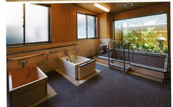
上 | 通所介護一般型 下 | 通所介護一般型浴室